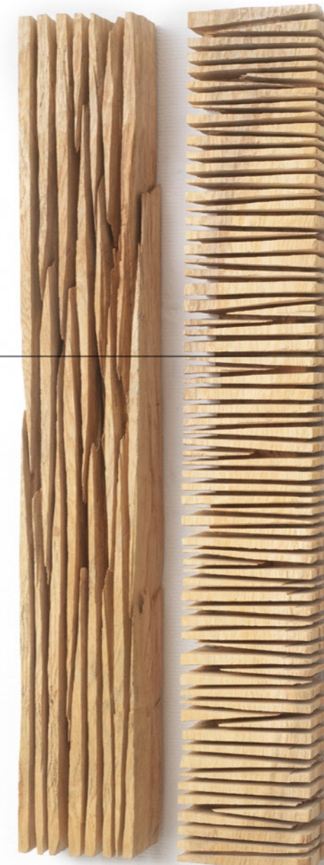
David Nash, Cross Cut and Up Cut , 2006, Esche, 102 x 16 x 11 cm, 2-teilig, © VG Bild-Kunst, Bonn 2026