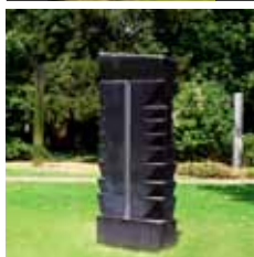
Heinz Mack: Schwarzer Prinz, 1992