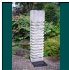
Heinz Mack: Weiße Marmor- skulptur mit Plinthe, 1988