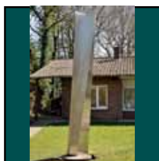
Horst Linn: o. T. 1994

LED Lichtinstallation, Betongehäuse 216 x 126 x 126 cm