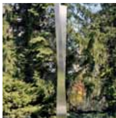
Horst Linn: o. T. 1994

Edelstahl poliert, mit Beleuchtung 314 x 100 x 40 cm