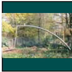
William Brauhauer: Raumplastik IV, 1999