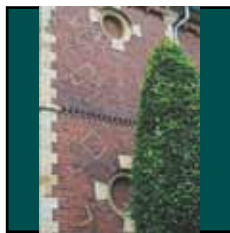
Günther Zins: Auftauchen, 2010