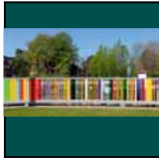
Christoph Dalhausen: Sliding Colours, 2018

Arylglas und pulverbeschichteter Stahl 1700 x 120 cm