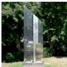
Heinz Mack: Lichtturm 1960 / 82

weißer Marmor, nach einem Tonmodell von 1954 260 x 116 x 71 cm