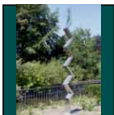
Heinz Mack: Zick-Zack-Steile, 1987