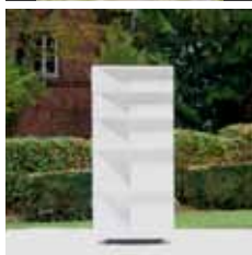
Heinz Mack: Rhythmus und Gelassenheit, 1954 / 86

weißer Marmor, nach einem Tonmodell von 1954 260 x 116 x 71 cm