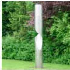
Peter Schwickerath: Durchdringung I/79 1979